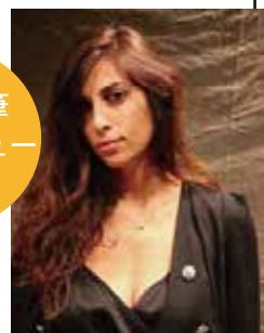
ヤスミン・ハムダン（レバノン） ジム・ジャームッシュ監督の映画 『オンリー・ラヴァーズ・レフト・アライヴ』にも出演