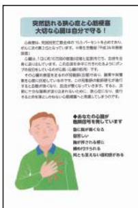
口絵 1 ページ目（上）

狭心症・心筋梗塞とはどのような疾患なのでしょう。それを理解していただくため、心臓の構造から説明したいと思います。