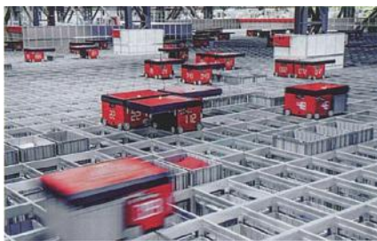
▲ロボット化された物流倉庫

2050年までに人口3000万人減するといわれる日本。今後は人手に頼らない業務の効率化は必須です。本書は、数々の生産活動の中でも「物流」を取り上げ、大手企業のサプライチェーン事例なども紹介しながら、手法や投資コストの考え方など、各企業に適した物流自動化を考えるガイドとなります。