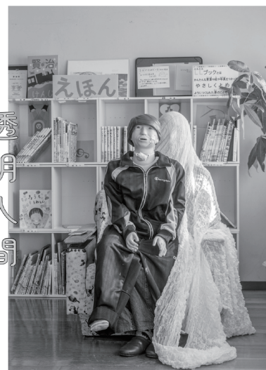
写真・文 山本美里

1980 年東京都生まれ。写真家、医療的ケア児の母。2008 年、妊娠中に先天性サイトメガロウイルス感染症に罹患した第 3 子が障害を持って生まれ、「医療的ケア」を必要とする子の親となる。その息子が特別支援学校小学部に入学するとともに、週 4 日の校内待機の日々が始まる。2017 年に京都芸術大学通信教育部美術科写真コースへと進み、息子に常に付き添う自分自身を被写体にした写真作品の制作を開始。同学学長賞も受賞した一連の作品を 2021 年 11 月に『透明人間 Invisible mom』として自費出版すると、大きな反響を呼ぶ。全国各地を展示と講演で回るさなか、2023 年 1 月に榎野展正氏による記事「隠された母親たち」がウェブ版「美術手帖」に掲載。それをきっかけに、『透明人間 Invisible mom』を再構成・再編集した本書を出版。同年、別作品で「MONSTER Exhibition 2023」優秀賞受賞。現在も医療的ケア児と特別支援学校の保護者付き添いをテーマに作品制作を続けている。